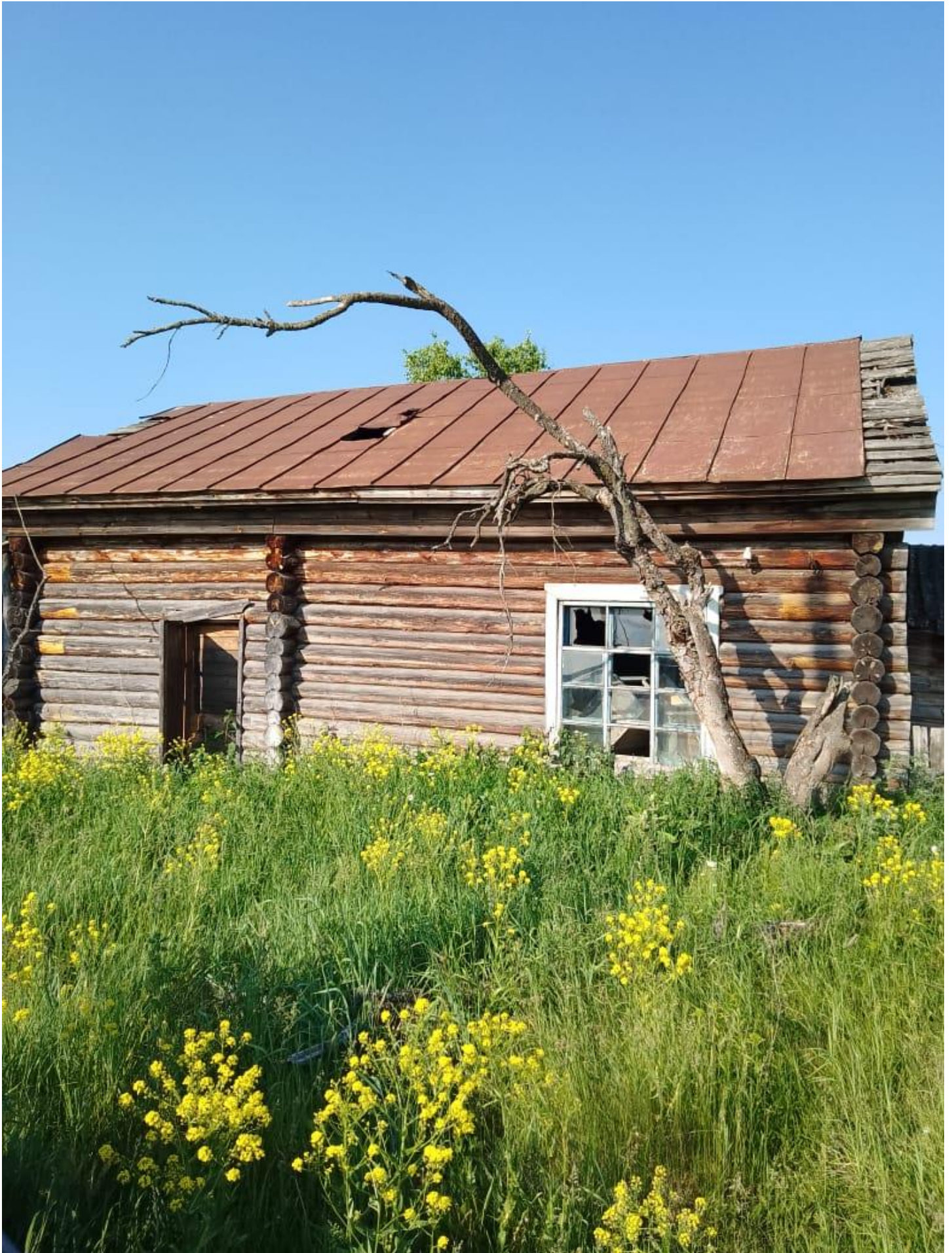
Фото 1 Лот №3