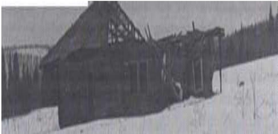
Фото 2 Лот №2

Нежилое здание – здание ветеринарного пункта, с. Бедярыш, ул. Лесная, 1