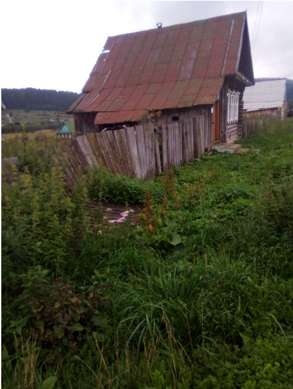
Фото 1 Лот №1