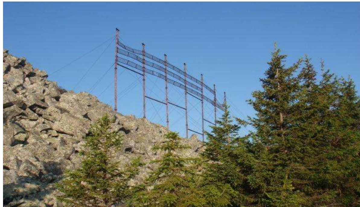
Артефакт или Стальной колосс на хребте Зигальга