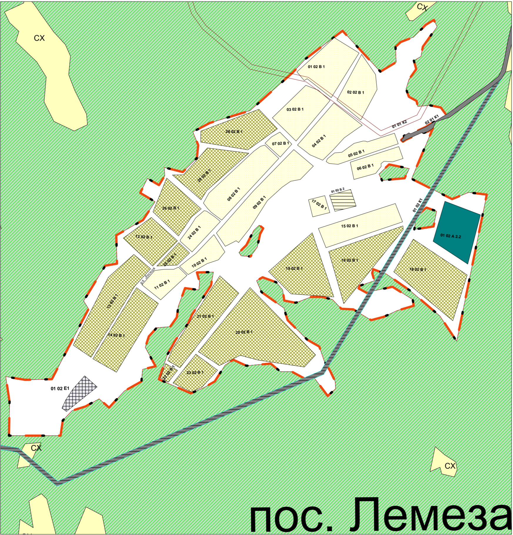
пос. Лемеза Масштаб 1:10000