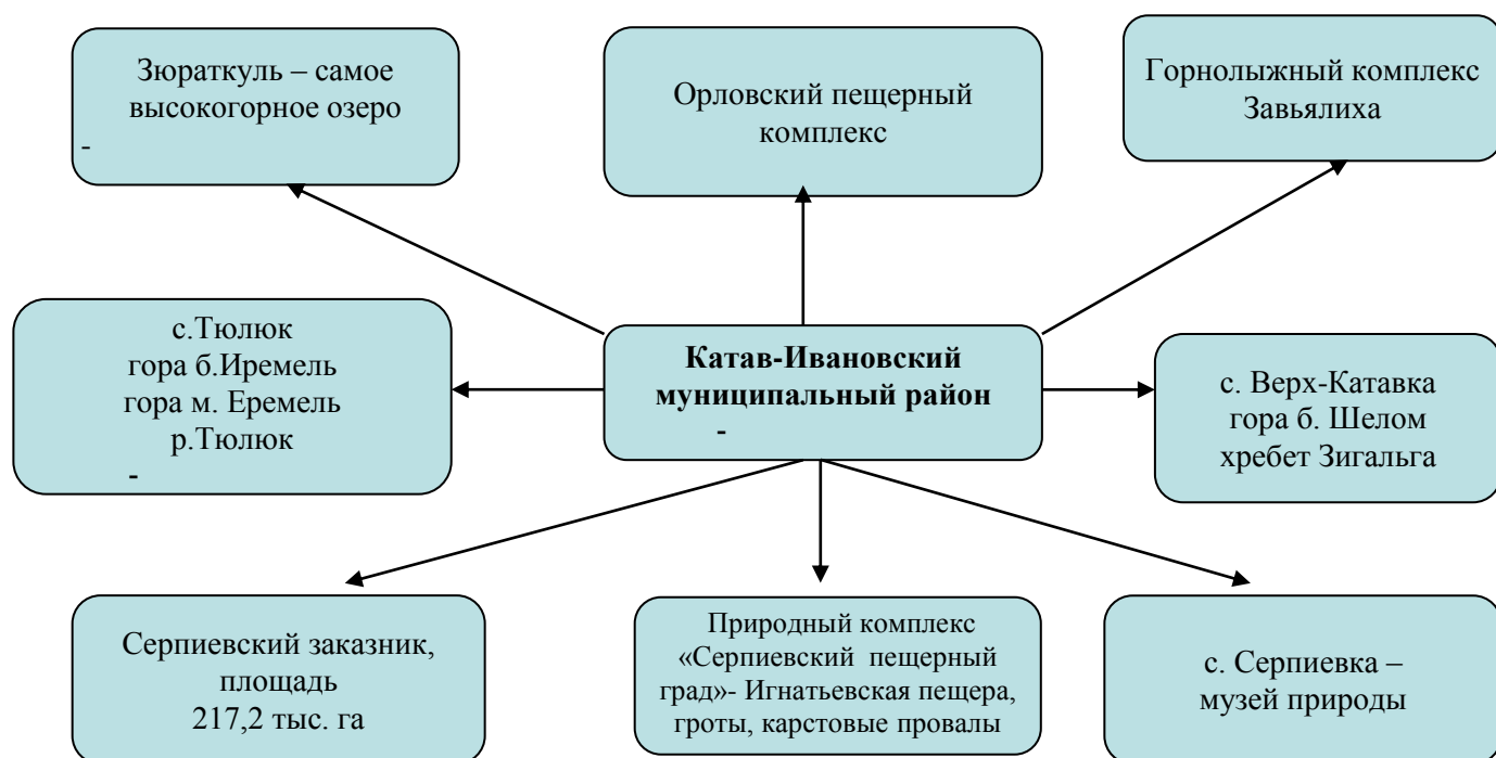
Схема туристических мест

Район привлекателен для туризма своими уникальными туристическими ресурсами. Насчитывает 11 памятников природы. Среди них памятник природного, культурного и исторического наследия «Игнатьевская пещера» эпохи палеолита, в которой обнаружено 50 групп наскальных рисунков, выполненных руками человека 14,5 тыс.лет назад. Всего на территории парка известно около 130 уникальных карстовых объектов, 12 из них были обжиты человеком.