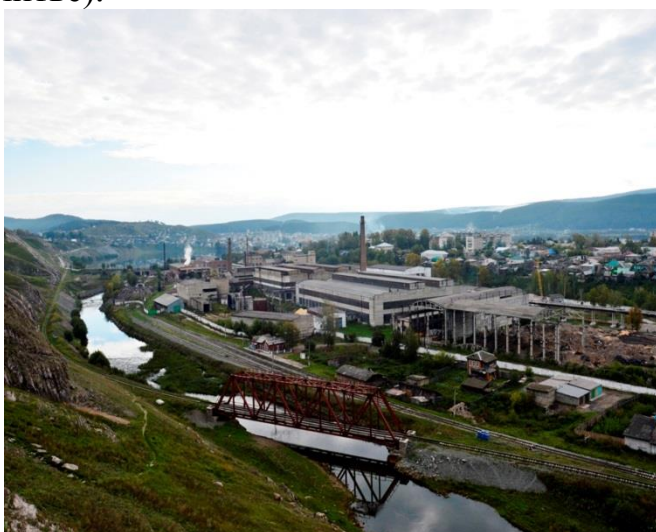
ООО «Катав-Ивановский литейный завод»

Изготавливаются любые отливки массой до 12 тонн (литьё по газифицируемым моделям, производство цилиндров мелющих: цельпечс чугунный, художественное литьё).