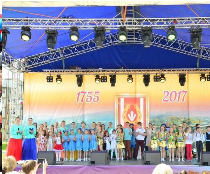
День города Катав - Ивановска

Клубные учреждения являются самыми массовыми учреждениями культуры и играют главную роль в организации досуга населения и находятся они в шаговой доступности.