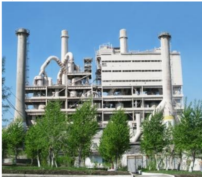
АО «Катавский цемент»

–ЦЕМ III/А 32,5Н – шлакопортландцемент от 35% до 60%, класса прочности 32,5, нормальноотвердевающий.