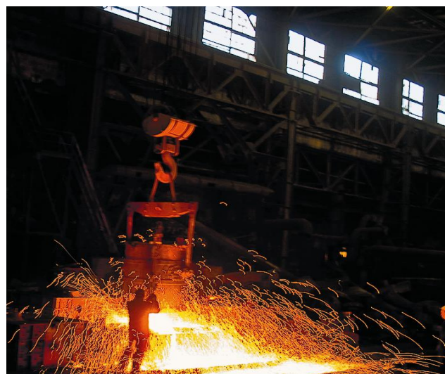
Разливка металла в цехе ООО «Катав-Ивановский литейный завод»