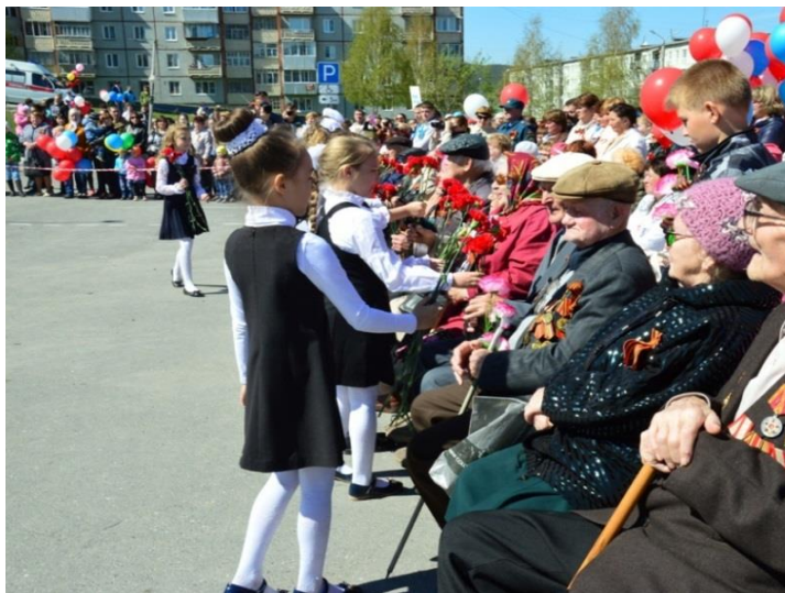
Празднование Победы в Великой Отечественной войне, 9 мая 2017 года