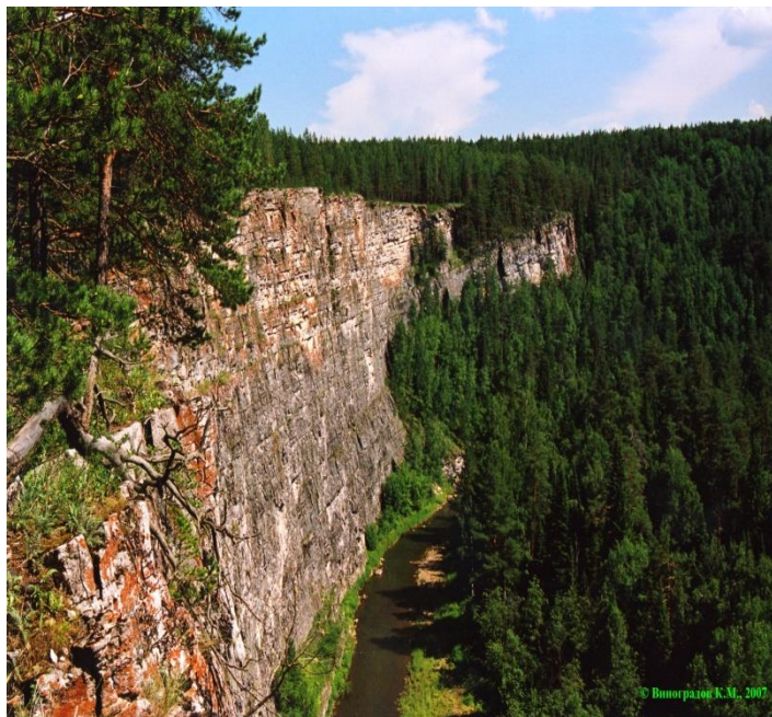
«Игнатьевская пещера» – памятник истории и культуры РФ