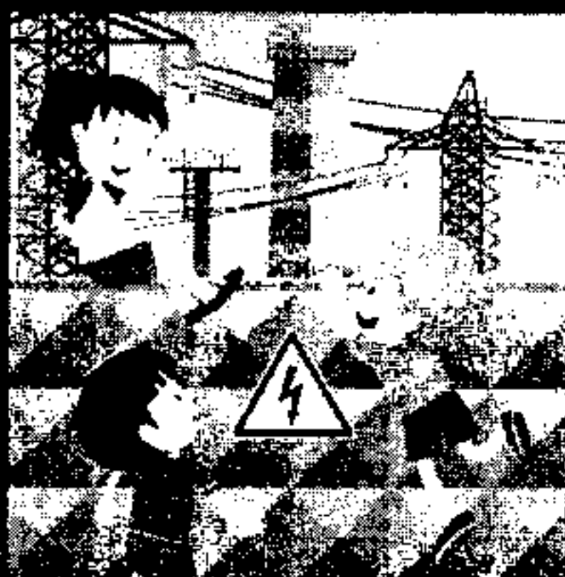
Не придумывай как достать или проникнуть! Позови взрослых!