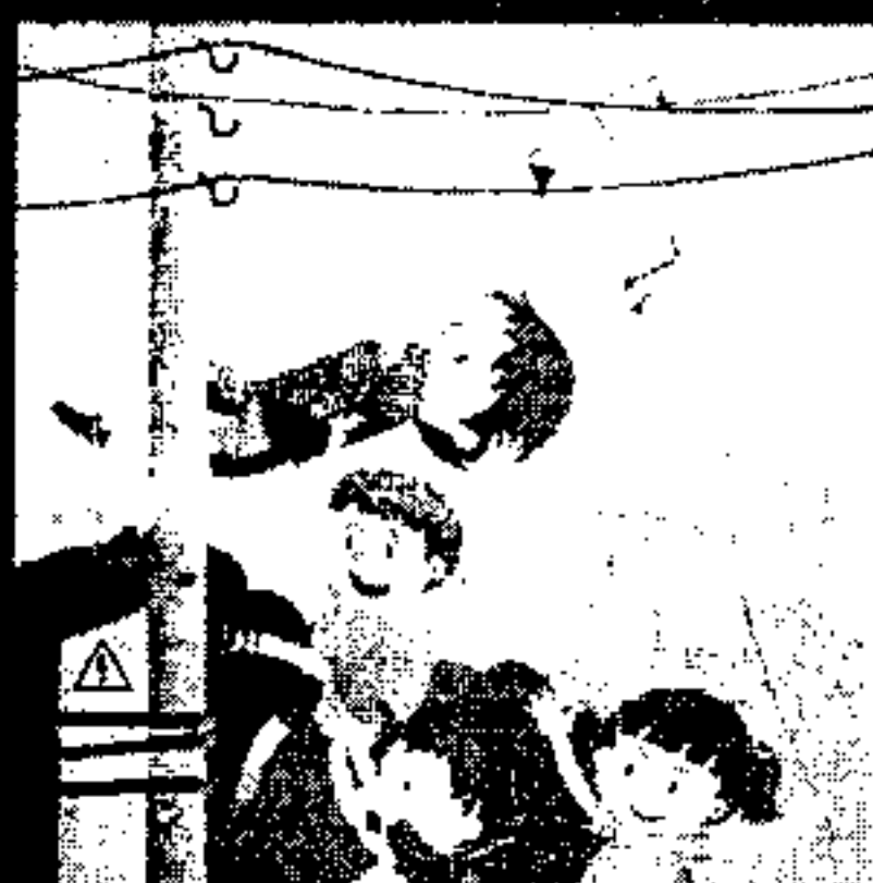
Нельзя играть вблизи линий электропередачи!