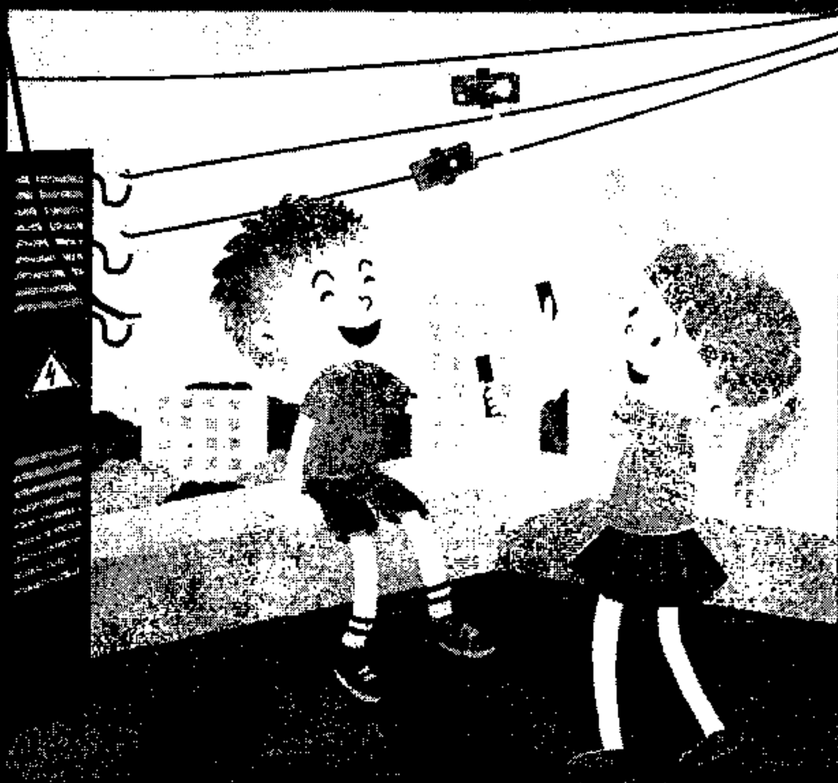
Нельзя использовать палку для селфи рядом с электрооборудованием и линиями электропередачи!

Обращаем ваше внимание на необходимость соблюдения правил поведения вблизи энергообъектов! Линии электропередачи и иные электроустановки – источник повышенной опасности! В зоне риска – наши дети! Энергетики убедительно просят вас, уделите пять минут и прочитайте вместе со своими детьми основные правила электробезопасности!