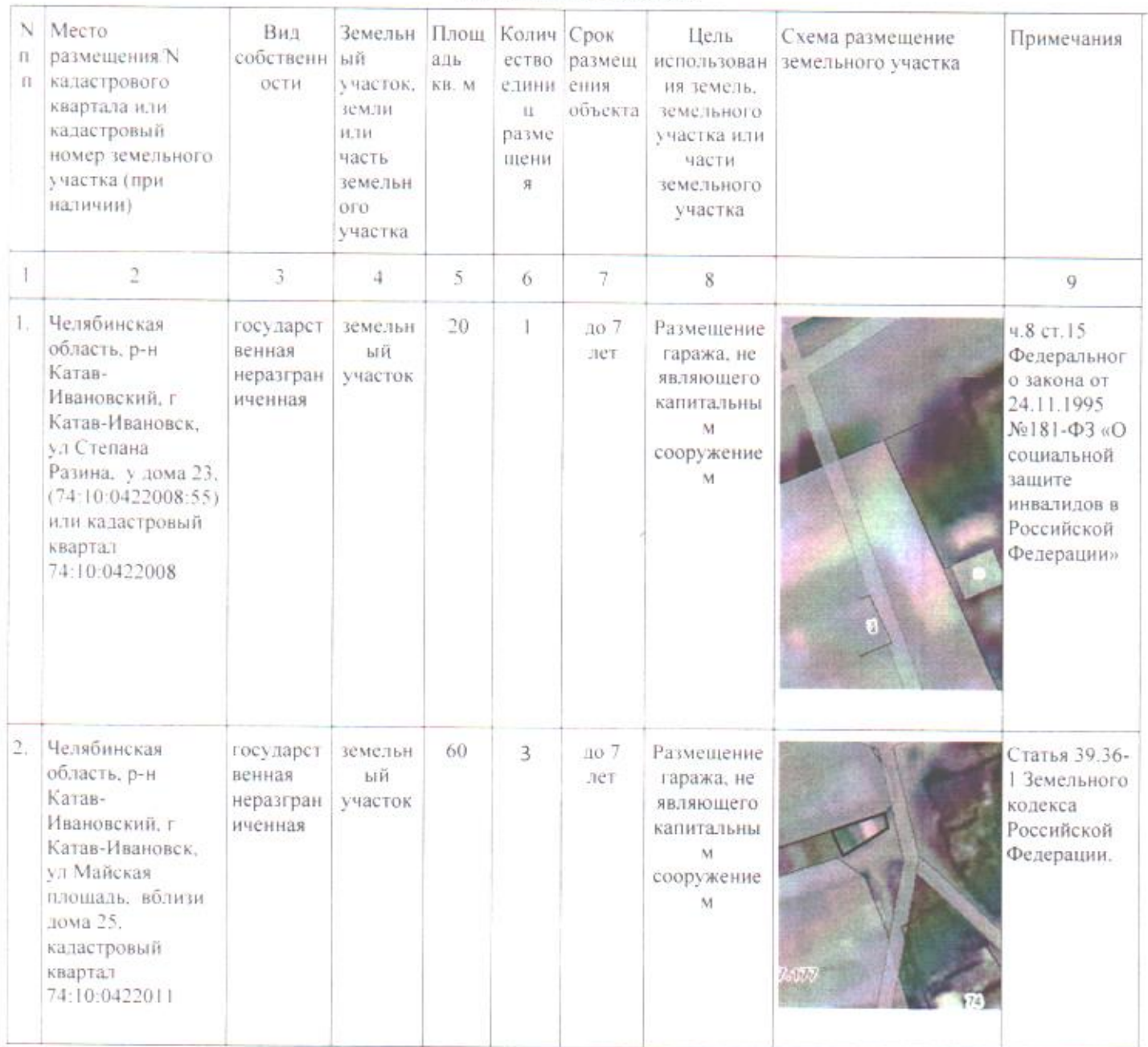
Схема размещения гаражей, являющихся некапитальными сооружениями, а также мест стоянки технических или других средств передвижения инвалидов вблизи их места жительства на земельных участках, находящихся в государственной и муниципальной собственности на территории Катав-Ивановского муниципального района