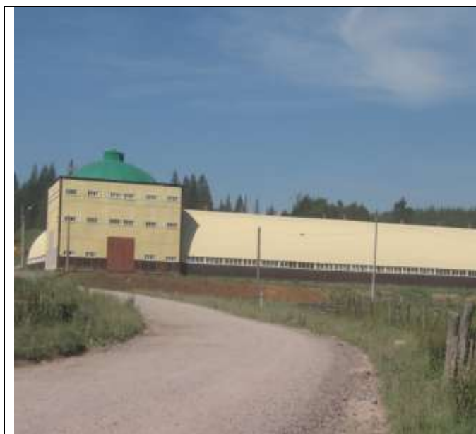
Строительство очистных сооружений хозбытовой канализации в г.Катав-Ивановске

Привлечение инвестиций в экономику района остается основным направлением в деятельности администрации.