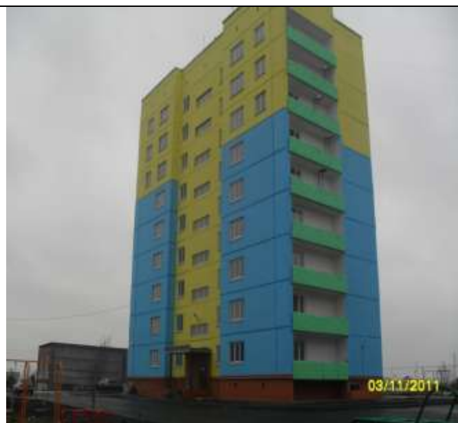
Сдан в эксплуатацию многоквартирный дом в г. Юрюзань