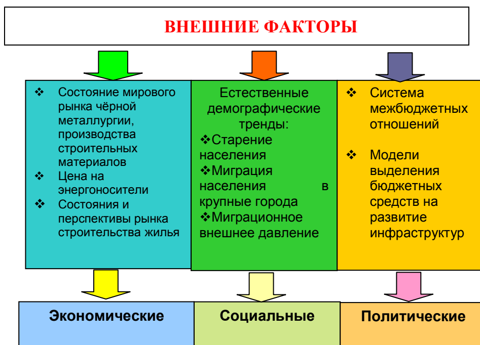
Значимые внешние факторы развития Катав-Ивановского района

Наиболее значимые внешние факторы развития Катав-Ивановского муниципального района показаны на рис.1.