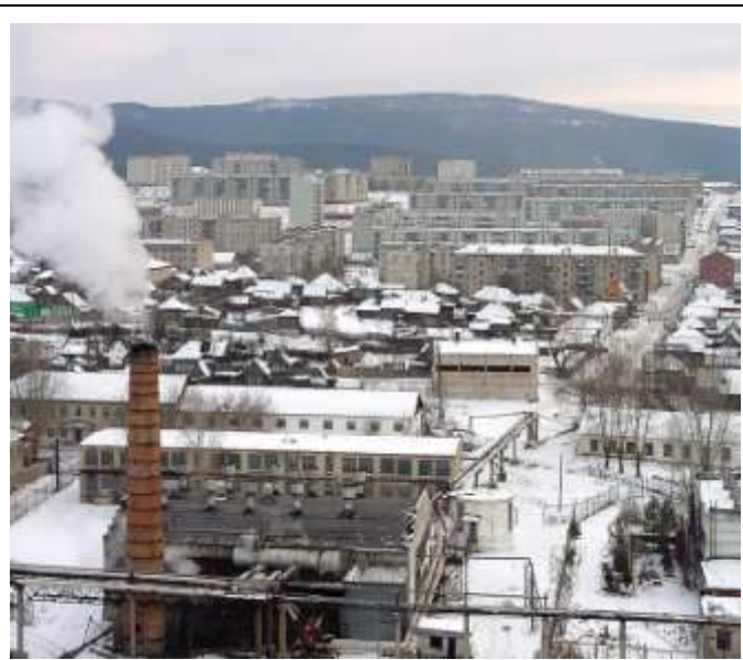
ООО «Катав-Ивановский механический завод»

В настоящее время на ООО «Альба-цепь» выпускается продукция – цепи для конвейеров металлургического и электротехнического производства, сельскохозяйственные цепи.