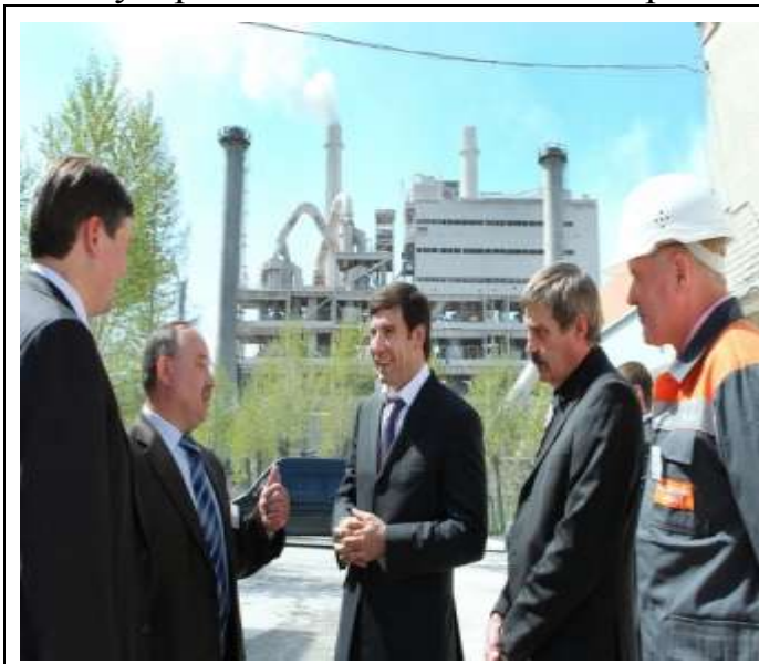
ЗАО «Катавский цемент»

Сегодня ЗАО «Катав-Ивановский приборостроительный завод»—единственный в России производитель магнитных компасов, лагов-измерителей пройденного расстояния судов и других навигационных приборов для кораблей военно-морского флота, а также судов морского и речного флотов России, катеров, шлюпок и яхт. Освоено производство и выпуск уникальных товаров гражданского назначения (электромагнитные клапаны, пневмораспределители для газовой и нефтехимической промышленности), а также товаров народного потребления. В целом номенклатура продукции завода включает около 200 изделий. Изделия завода удовлетворяют международным и национальным требованиям.